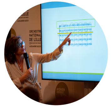
Orchestre national de Lille 2023