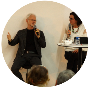
En compagnie de John Adams Auditorium de Lyon-2017